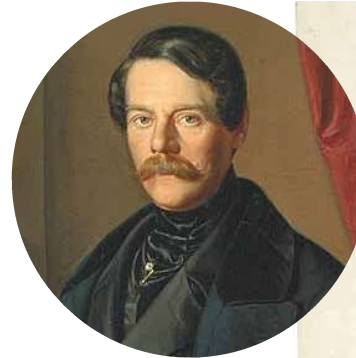
Neben den bewährten Ordensspitälern entwickelte sich die Idee des Allgemeinen Krankenhauses. Auch der erste konstitutionell gewählte Bürgermeister der Stadt Linz, Reinhold Körner (1803–1873), war ein wortmächtiger Vorkämpfer für die Errichtung eines weltlichen Krankenhauses, des späteren AKH. Zugleich zollte er den Barmherzigen Schwestern seine Anerkennung. „Die großen Verdienste, welche sich zeither das Institut der barmherzigen Schwestern um die leidende Menschheit erworben hat, sind genügend bekannt, und werden auch von der neuen Gemeindevertretung vollkommen und dankend anerkannt.“ 51 so Reinhold Körner in dieser Note aus dem Jahr 1861, mit der er sich für die Zusendung des Jahresberichtes bedankte.