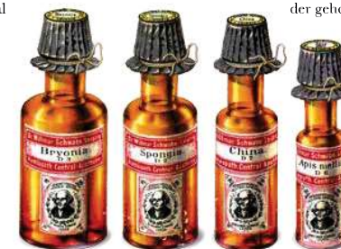
Kleine Fläschchen enthalten homöopathische Arzneien, mit denen im Krankenhaus der Barmherzigen Schwestern behandelt wurde. Von 1841 bis 1901 gehörte das Krankenhaus zu den homöopathischen Musteranstalten im deutschsprachigen Raum.