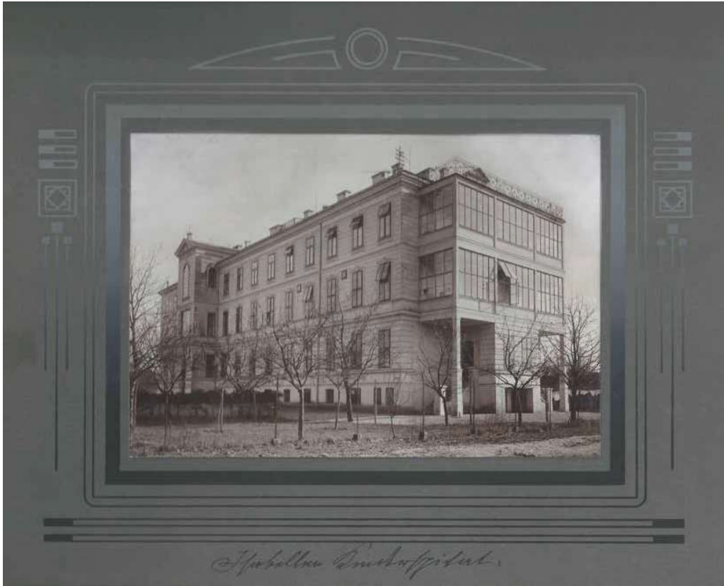
Richtungsweisende Pflege durch die Barmherzigen Schwestern auch im Isabeller-Kinderspital, das im Jahr 1886 eröffnet wurde. Bereits 1881 war unter dem Protektorat von Erzherzogin Isabella der Kinderspitalsverein gegründet worden, der es sich zur Aufgabe machte, die erforderlichen Mittel für die Erbauung, Einrichtung und Erhaltung zu beschaffen.