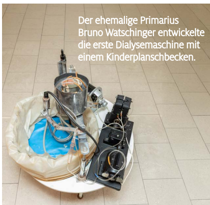
Der ehemalige Primarius Bruno Watschinger entwickelte die erste Dialysemaschine mit einem Kinderplanschbecken.

Wie wichtig die Nieren sind, zeigt sich meist erst dann, wenn ihre Funktion gestört ist. Bei gesunden Menschen filtern die Nieren schädliche Stoffe aus dem Blut, damit sie mit dem Urin ausgeschieden werden können. Sie regeln den Flüssigkeits- und Säure-Basen-Haushalt, den Blutdruck und die Bildung der roten Blutkörperchen. Bei