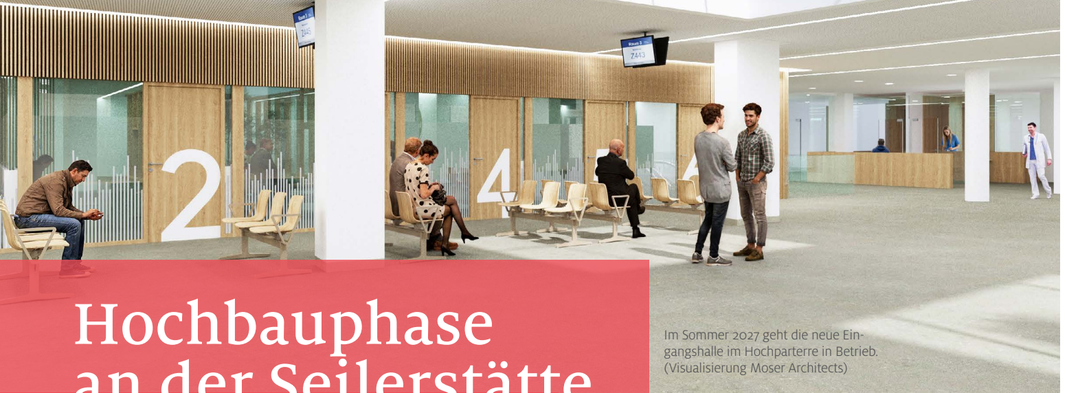
Im Sommer 2027 geht die neue Eingangshalle im Hochparterre in Betrieb. (Visualisierung Moser Architects)