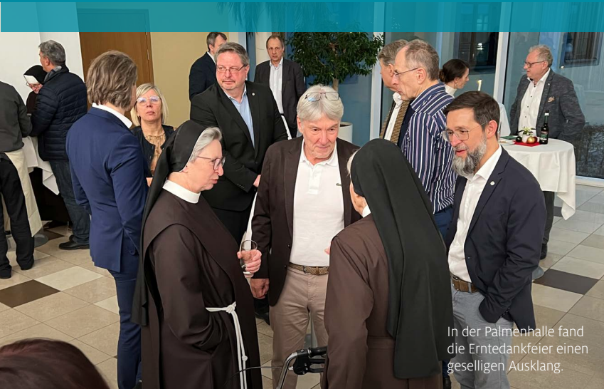
In der Palmenhalle fand die Erntedankfeier einen geselligen Ausklang.