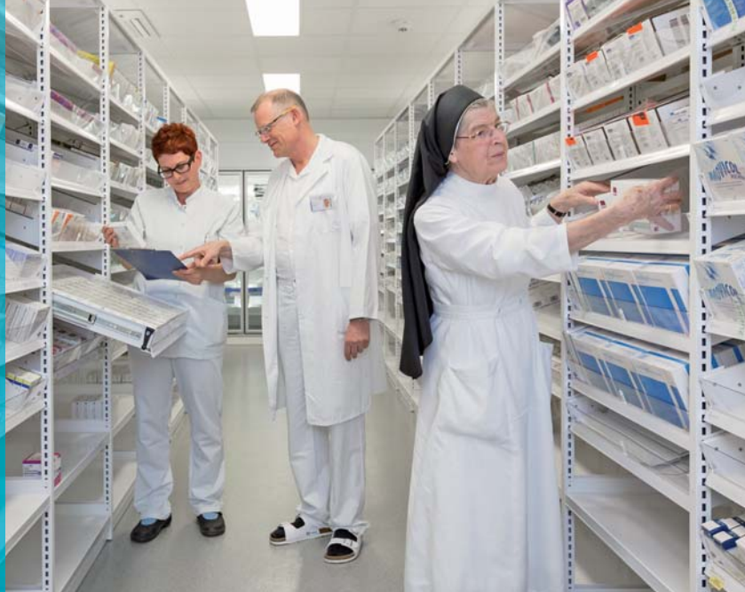
Das Team der Apotheke verwaltet über 2.000 Medikamente.