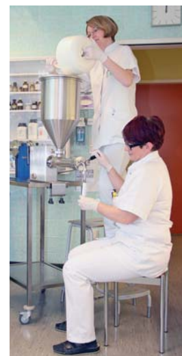
Auch heute werden in der Apotheke immer noch Rezepturen selbst hergestellt.

Als absehbar wurde, dass es zu einer Verknappung von Händedesinfektionsmitteln am Markt kommen würde, ist die Apotheke frühzeitig tätig geworden. In Deutschland wurde eine Ausnahmegenehmigung zur Biozid-Verordnung für die Produktion von Desinfektionsmitteln aus Ethanol oder Isopropanol mit Beginn der Pandemie erlassen. „Ich hatte zufällig am Apothekerkongress in Schladming die Gelegenheit, mit der Präsidentin der Österreichischen Apothekerkammer, welche auch am Kongress anwesend war, diese Problematik zu besprechen, um auch den Anstoß für eine entsprechende Ausnahmeregelung in Österreich zu geben. Das ist auch gelungen, sodass wir die verfügbare Menge an Isopropanol für die Händedesinfektionsmittelherstellung nach einer