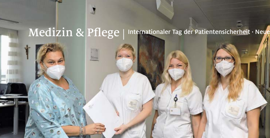
Am Internationalen Tag der Patientensicherheit macht unser Risikomanagement-Team an beiden Standorten auf dieses wichtige Thema aufmerksam.